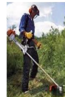
Espaces verts ( pour la formation )

Bien que ne faisant pas partie des activités agricoles, la filière aménagement et entretien des espaces verts a été intégrée à l'analyse, notamment parce que les formations permettant d'accéder à ces activités relèvent du ministère de l'agriculture et de l'alimentation.