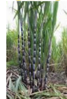
Canne à sucre