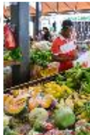
Fruits et légumes : arboriculture fruitière (ananas, melon ..), maraichage