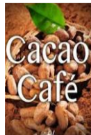
Filières de niche (café, cacao, PAM...)