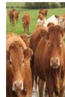
Elevage (bovin, porcin, avicole...)